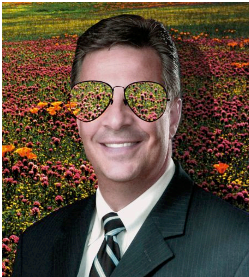
Graphisme : Jérémie Mercier